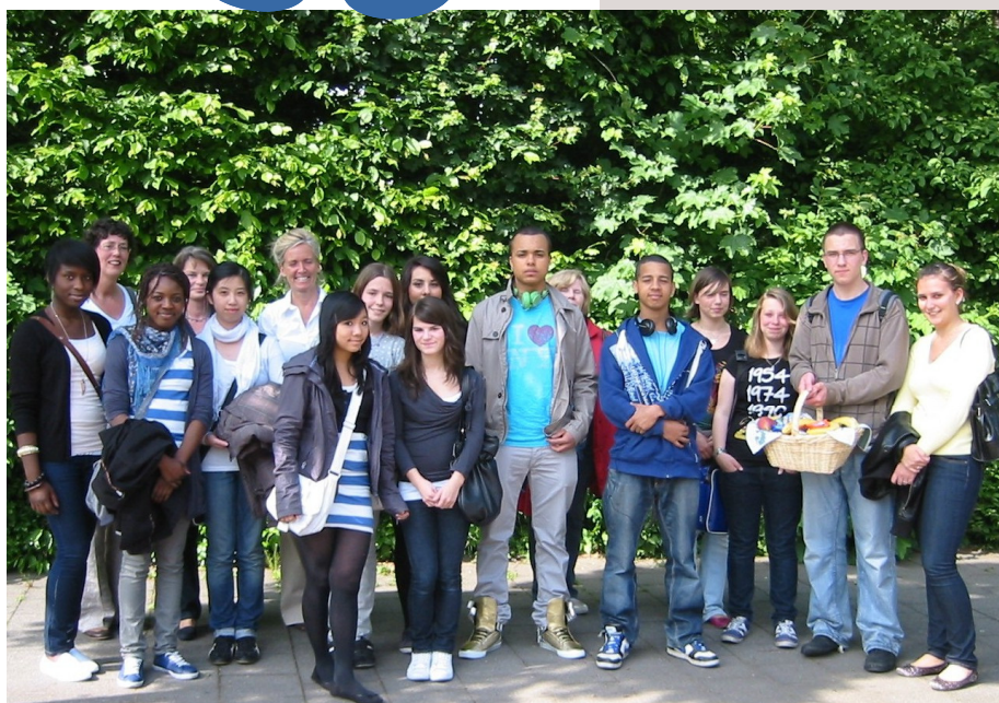
Die glücklichen Preisträger/innen mit Projektleiterinnen bei der Abfahrt nach Oberhausen zum Musical „Wicked - die Hexen von Oz“